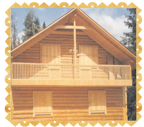
Артственā iesūkšanās spēja /