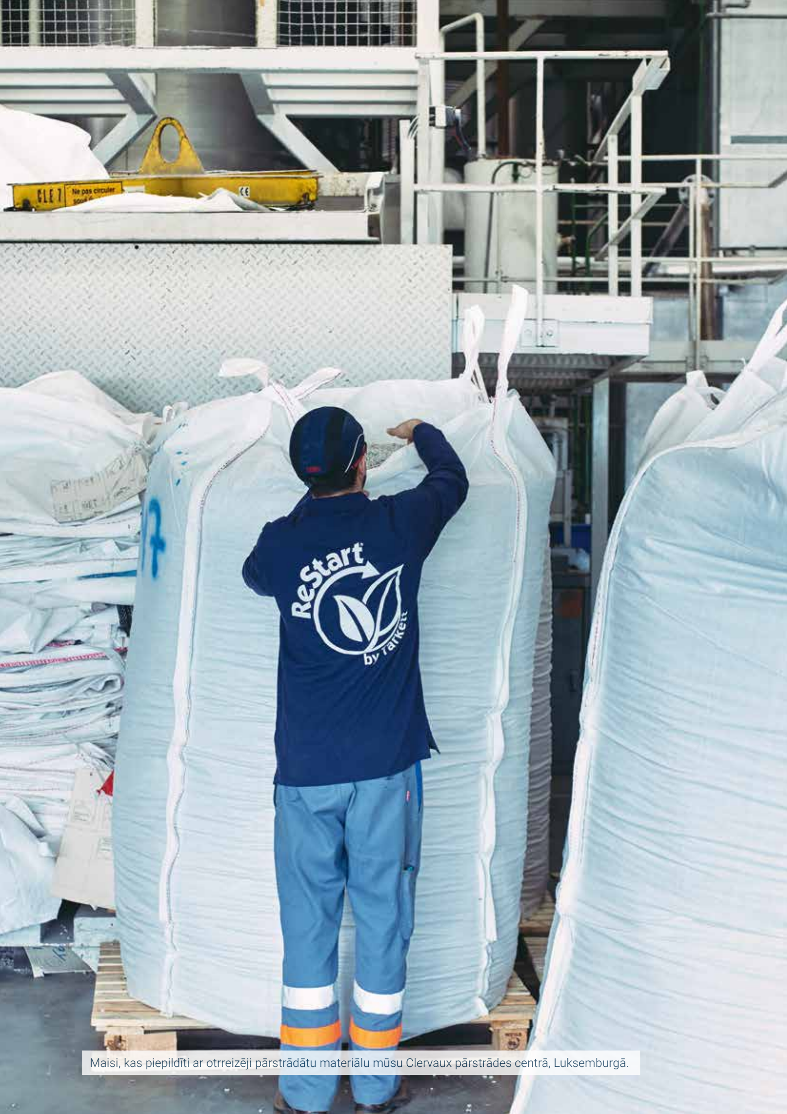
Maisi, kas piepildīti ar otrreizēji pārstrādātu materiālu mūsu Clervaux pārstrādes centrā, Luksemburgā.