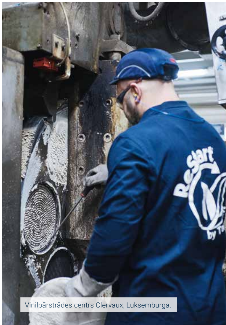
Vinilpārstrādes centrs Clervaux, Luksemburga.